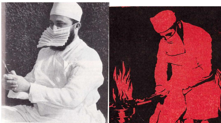
Индийский огнепоклоннику Бомбей, храм огня. М. Бойс

В период Ислама эти храмы, в основном Шейх Сафи, стали храмами поклонения Суфиев [2, 111].