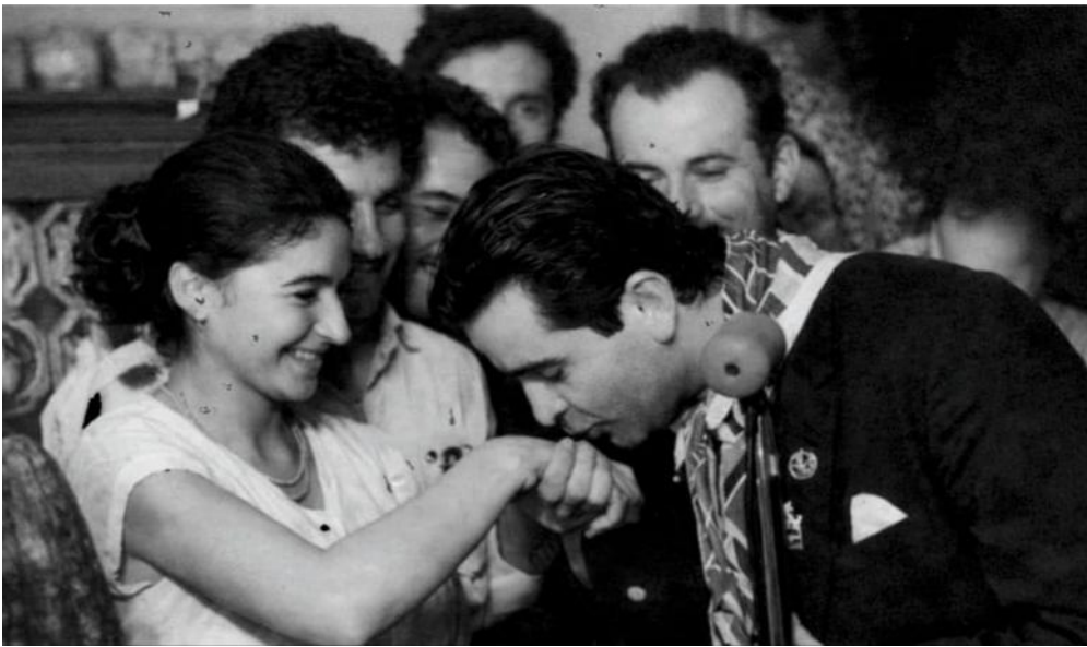
Şəkil: 3. Asya Tağıyeva və Radj Kapur

Həmin festivalda Asya xanım dünyaşöhrətli kinoaktyor Radj Kapur ilə tanış olur. Təqdim olunan şəkildə onların rəsmi əks etdirilmişdir [Şəkil: 3]